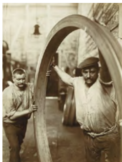
Transport naadloze wielband, 1899

Reeds in 1912 richtte het bedrijf Krupp een eigen cinematografische afdeling op. In deze ruimte bestaat de mogelijkheid 18 geselecteerde historische films op te roepen. Ze ontstonden tussen 1928 en 1964.