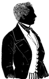
Friedrich Krupp (1787–1826)

In 1811 richtte de koopmanszoon Friedrich Krupp in Essen een gietstaalfabriek op. Hij was de eerste op het Europese continent die kwaliteitsstaal volgens Engelse methodes produceerde. Het werd gebruikt voor snij- en schafwerktuigen, muntstempels en rollen. Het allerbegin was niet erg veel belovend. Toen Friedrich Krupp op 39-jarige leeftijd stierf, liet hij een bedrijf met een hoge schuldenlast achter.