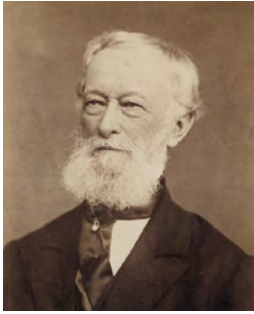
Alfred Krupp (1812–1887)