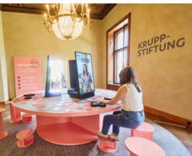
Eetkamer in het Kleine Huis, ca. 1906, en kamer aan de Krupp Stichting

Op de bovenverdieping wordt de geschiedenis van de firma Krupp van het begin 200 jaar geleden tot het heden gepresenteerd.