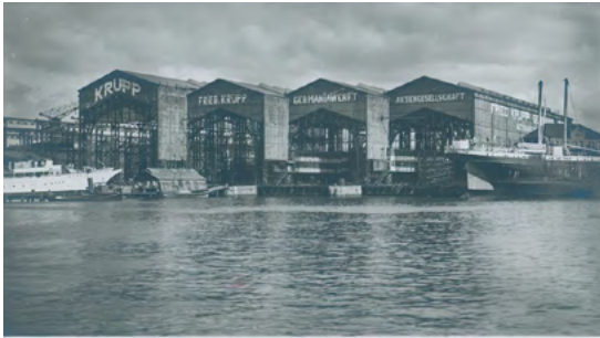
Fried. Krupp Germaniawerft in Kiel, ca. 1930

Onder leiding van Friedrich Alfred Krupp werd in 1896 een hoogovenbedrijf in Rheinhausen gebouwd. Het bedrijf kwam in 1893 tevens in het bezit van de Gruson fabriek in Magdeburg en in 1896 van de Germania scheepswerven in Kiel.