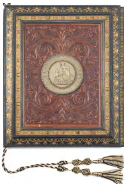
Erecertificaat voor Friedrich Alfred Krupp, 1896

In de „schatkamer“ worden pronkstukken uit het veelomvattende historische archief Krupp tentoongesteld. De prachtige stukken stonden nooit centraal in de geschiedenis van Krupp maar vertellen wel elk hun eigen verhaal.