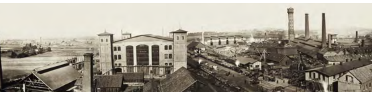
Werkspano- rama, 1864

Das Krupp-Archiv übernimmt kontinuierlich Quellen, erschließt sie systematisch und sorgt für ihren dauerhaften Erhalt. Als Langzeitgedächtnis leistet es internen Service für die Alfried Krupp von Bohlen und Halbach-Stiftung und die thyssenkrupp-Unternehmensgruppe. Mit Publikationen, eigenen Präsentationen und der Betreuung der »Historischen Ausstellung Krupp« fördert es die geschichtliche Bildung.