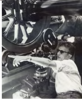
Filmaufnahmen bei Krupp, 1959