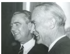
Alfried Krupp von Bohlen und Halbach (à droite) et Berthold Beitz