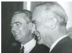
Alfried Krupp von Bohlen und Halbach (rechts) en Berthold Beitz

De Alfried Krupp von Bohlen und Halbach-Stichting ten behoeve van het algemeen nut is de uiterste wilsbeschikking van Dr.-Ing. E. h. Alfried Krupp von Bohlen und Halbach, de laatste persoonlijke eigenaar van de firma Fried. Krupp. In zijn testament heeft hij bepaald, dat zijn gehele vermogen na zijn dood over zou gaan in de handen van deze stichting ten behoeve van het algemeen nut. Dit werd mogelijk doordat zijn enige zoon,